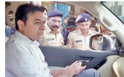
విచారణ కోసం లాయర్ ను అనుమతించని ఎసిబి, ఆగ్రహంతో వెనుదిరిగిన కెటిఆర్ మళ్ళీ 9న రావాలని ఎసిబి నోటీసులు

హైదరాబాద్, జనవరి 6, ప్రభావవార్త: రాష్ట్రంలో సంవలనం రేపిన ఫార్మూలా ఈ కార్ రేసుకు సంబంధించిన కేసులో ఎసిబి విచారణకు సోమవారం ఉదయం హాజరైన మాజీ మంత్రి, బిఆర్ఎస్ నేత కెటిఆర్ తన వెంట న్యాయవాదిని అనుమతించక పోవడంతో నిమిషాల వ్యవధిలోనే విచారణాధికారికి ఒక లిఖితపూర్వక లేఖను అందించి వెనుదిరిగారు. ఈ సందర్భంగా బంజారాహిల్స్ లోని ఎసిబి ప్రధాన కార్యాలయం వద్ద హైదరాబాద్ చోటుచేసుకుంది. కాగా సోమవారం సాయంత్రం ఎసిబి అధికారులు మరోసారి కెటిఆర్ కు నోటీసులు జారీ చేసి ఈ నెల తొమ్మిదవ తేదీన విచారణకు రావాలని ఆదేశించారు. ఈసారి విచారణకు కూడా న్యాయవాదిని అనుమతించేది లేదని, ఒక్కరే రావాలని ఎసిబి పేర్కొంది. మరోవైపు రాయదుర్గంలోని కెటిఆర్ నివాసం వున్న ఓరింటల్ విల్లాలో ఎసిబి అధికారులు సోమవారం ఉదయం పదిన్నర గంటల సమయంలో రాయదుర్గంలోని తన నివాసం నుంచి కెటిఆర్ బంజారాహిల్స్ లోని ఎసిబి ప్రధాన కార్యాలయానికి వచ్చారు. కెటిఆర్ ఎసిబి కార్యాలయానికి వచ్చినప్పటికీ విషయం తెలుసుకున్న స్టాఫ్ పోలీసులు ఎసిబి ప్రధాన కార్యాలయం వద్ద బందోబస్తు ఏర్పాటు చేశారు. ఇదే సమయంలో కెటిఆర్ తన న్యాయవాదితో పాటు ఎసిబి ప్రధాన కార్యాలయానికి రాగా బందోబస్తులో వున్న స్టాఫ్ పోలీసులు న్యాయవాదికి అనుమతి లేదని, మీరు >>2