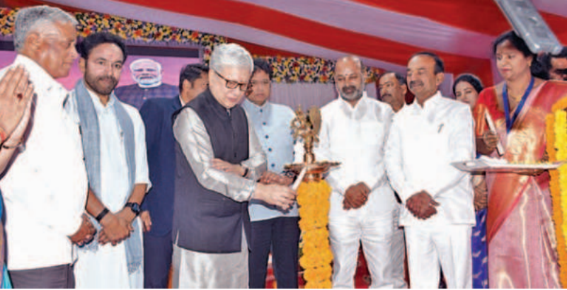
చర్యల రైల్వే టెర్మినల్ను జ్యోతి వెలిగించి ప్రారంభిస్తున్న రాష్ట్ర గవర్నర్ జిష్టుచేపి చర్య. చిత్రంలో కేంద్ర మంత్రులు కిషన్ రెడ్డి, బండి సంజయ్ తదితరులు