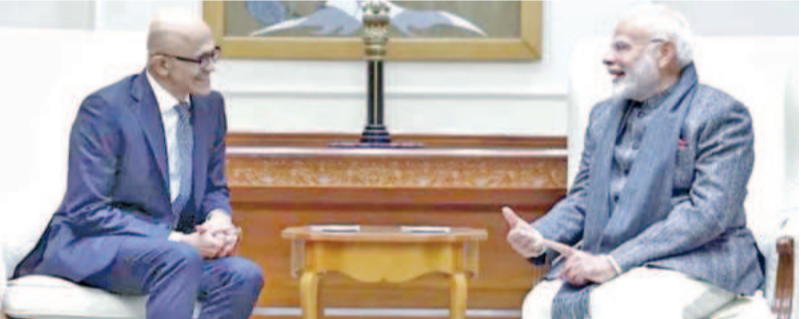
సోమావారం న్యూఢిల్లీలో ప్రధాని మోడీతో భేటీ అయిన మైక్రోసాఫ్ట్ సీ.ఇ.బి. సత్య నాదెళ్ల

>> నంబర్లో క్రాఫ్ట్ (కాంప్యూటర్ రిసెర్చ్) అనే పేరోడ్ కూడా ఉంది. ఈ పేరోడ్ తమకు ఇందు పరిశ్రమించకుండా రాకెట్ 4వ దశలో ఏర్పాటు చేసిన పోయంలో అమర్బుది ఉంటుంది. అందులో ఇరో శాస్త్రవేత్తలు రూపొందించిన క్రాఫ్ట్ పేరోడ్లో 8 అలసంద విత్తనాలను పంపించి ఉన్నారు. త్రిమండ్రంలోని విక్రమ్ సారాభాయ్ స్పేస్ సెంటర్ ఈ పరిశోధన అభివృద్ధి చేసింది. సూక్ష్మ గురుత్వాకర్షణ వాతావరణంలో మొక్కల ఎదుగుదలపై అధ్యయనం చేయడం దీని ప్రధాన ఉద్దేశం. ఈ ప్రయోగం జరిగిన కొన్నిరోజులకు క్రాఫ్ట్లో ఉన్న 8 విత్తనాలు మొలకెత్తినట్లు ఇరో గుర్తించింది. వాటికి త్వరలోనే అరులు కూడా వస్తాయని శాస్త్రవేత్తలు నమ్ముతున్నారు. అంతరిక్షంలోని ఎప్పటికప్పుడు కెమెరాతో చిత్రీకరిస్తున్నారు. ఆక్సీజన్, కార్బన్ డయాక్సైడ్ గాఢతను కొలవడం, నేల తేమ వర్షవేగం కూడా ఇందులో కొన్ని ఏర్పాట్లు ఉన్నాయి. సుదీర్ఘ అంతరిక్ష యాత్రలకు అనుసంధానం పరిశోధనకు ఈ నెల 9 నుంచి మొదలవుతుంది ఇరో సోమావారం ప్రకటించింది. గత నెల 30న ప్రయోగించిన రెండు స్పెడ్స్ కు ఇప్పటికే డాకింగ్ కార్యక్రమాన్ని ఈ నెల 7 నుంచి జరుగుతుందని మొదట ప్రకటించారు. అయితే మరోకొన్ని కీలక సునిశితమైన పరిశోధనల అసంతరం రెండోరోజుల తర్వాత ఇన్సైట్ భూకేంద్రం నుంచి శాస్త్రవేత్తలు పరిశోధనలు చేయనున్నారు.