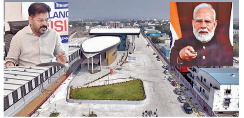
ప్రధాని మోడీని కోరిన సిఎం రేవంత్ రెడ్డి చర్లపల్లి రైల్వే లైన్ ను ఆర్ఆర్ఆర్ కు అనుసంధానించాలి కొత్త టెర్మినల్ ను వర్చువల్ గా ప్రారంభించిన ప్రధాని కార్యక్రమంలో వర్చువల్ గానే పాల్గొన్న సిఎం హాజరైన కేంద్ర మంత్రులు కిషన్ రెడ్డి, బండి సజయ్

ప్రభావవార్త ప్రధాన ప్రతినిధి, హైదరాబాద్, జనవరి 6: దేశవ్యాప్తంగా హైస్పీడ్ రైళ్ల కోసం డిమాండ్ పెరుగుతోందని, టూరిజంతో పలు రాష్ట్రాలకు ఆర్థికవృద్ధి చేకూరుతుందని ప్రధాని నరేంద్రమోడీ ఆన్ లైన్ లో సోమవారం చర్లపల్లి రైల్వే టెర్మినల్ ను వర్చువల్ గా ప్రారంభించి >>2