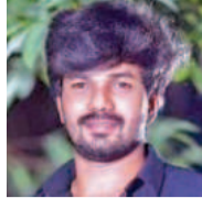
చర్యతం శ్రీరామ్ (ఫైలి)